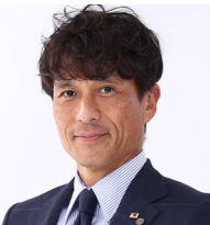
公益財団法人日本サッカー協会