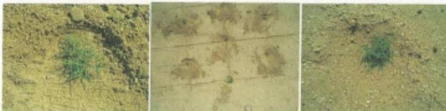
④踏みつけた後、周囲の土をポット苗の周りに戻す