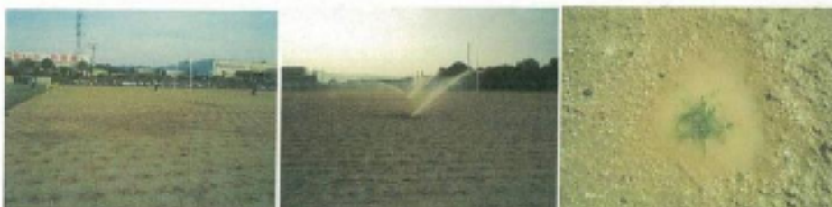
⑤移植当日はたっぷりと散水する