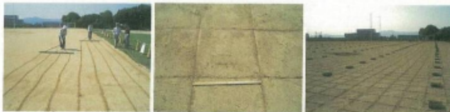
①50cm間隔にラインを引き、苗箱(25株)を配置する