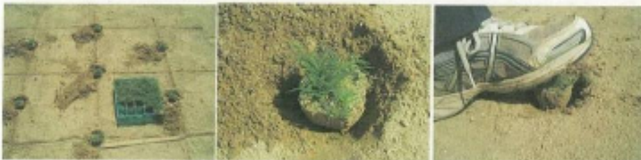
③ポット苗を1株ずつ穴に置いて、足でしっかりと踏みつける