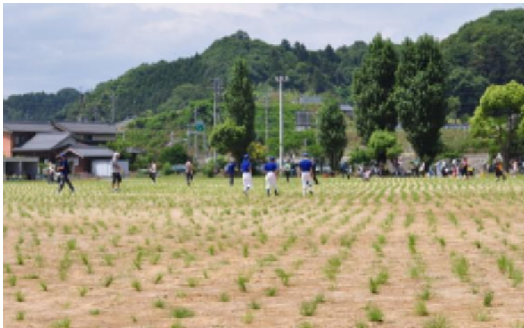
2009年6月21日 植付けの様様