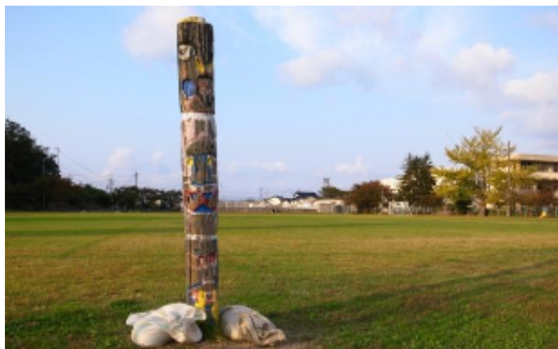
芝生の模様 撮影日 10月24日